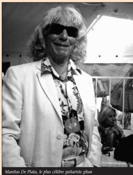
Manitas De Plata, le plus célèbre guitariste gitane