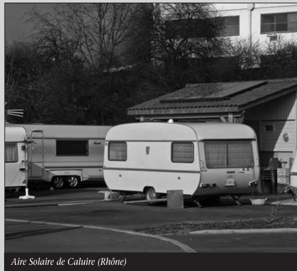
Aire Solaire de Caluire (Rhône)

Les familles du voyage habitent des caravanes, des résidences mobiles ou des résidences immobiles. Elles habitent à l'entrée des villes, à la sortie des villes, des lieux trop souvent sans qualité. En 2000, pour organiser leur passage, le législateur a créé une loi qui prévoit la réalisation d'aires d'accueil dans les villes inscrites pour cela aux schémas départementaux. Lentement, ces équipements voient le jour. Qu'elles soient résidentes du lieu ou de passage, l'habitat est une préoccupation majeure pour les familles du voyage. Les prises de conscience sur la qualité de notre environnement concernent tous les modes d'habitat.