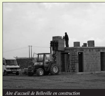
Aire d'accueil de Belleville en construction

Les aires d'accueil ne répondent qu'en partie au problème du stationnement des Gens du Voyage dans le sens où ceux qui continuent leur mode de vie itinérant sont les personnes les plus aisées et peuvent se permettre de payer la redevance des terrains.