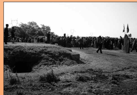
Le 28 avril sur le site de l'ancien camp de Montreuil-Bellay. Au premier plan, la prison souterraine ; à droite, la stèle érigée en janvier 1988