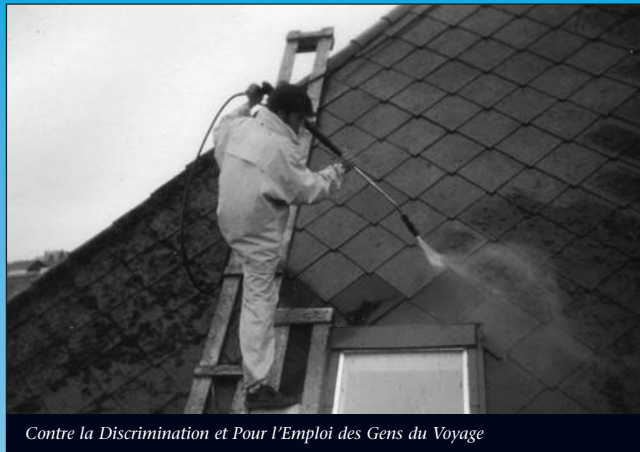
Contre la Discrimination et Pour l'Emploi des Gens du Voyage