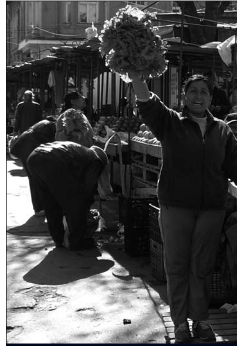
Marché des femmes de Sofia

L'Europe est un lieu où de nombreuses initiatives pour la défense des droits des Roms et des Gens du Voyage ainsi que l'amélioration de leurs conditions de vie se développent. Souvent plus favorables au respect des droits des Gens du Voyage que les politiques nationales, les politiques et les institutions européennes constituent un espace dans lequel nous devons y inscrire notre lutte avec les Voyageurs français, à la fois pour le respect de leurs droits de citoyens français, et pour la reconnaissance de leur culture et de leur mode de vie.