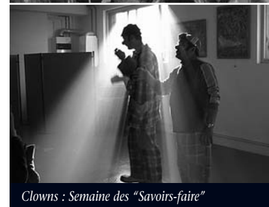
Clowns : Semaine des "Savoirs-faire"